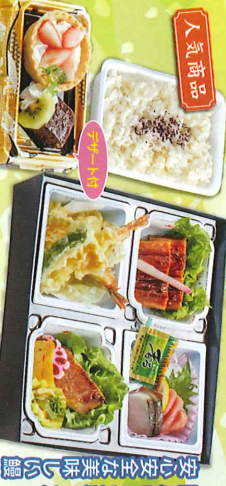
安心安全な美味しさを 国産こだわった