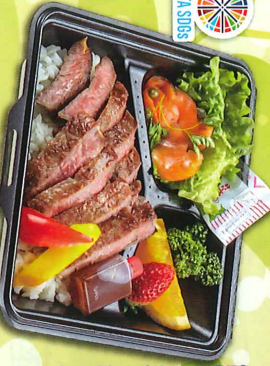
親子かきと美味い、と評判なこだわりランチ