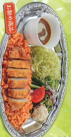
美味しさを 一品きよた逸品！