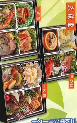
ご利用NO.1の人気商品！ 三役重りランチ