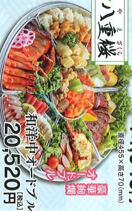
豪華絢爛 人気のお土産品