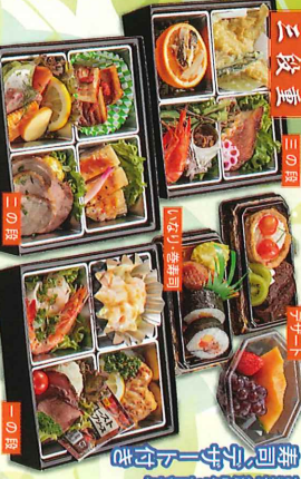
豪華絢爛三役重り 寿司ランチと行き