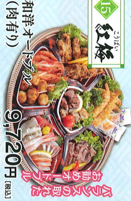
豪華絢爛 人気のお土産品