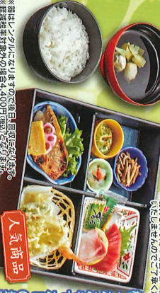
様々なお好みでいただける 法事や行事、お祝い事などの