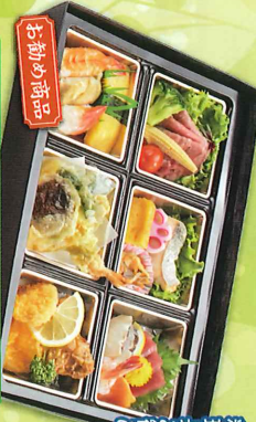
料理長お勧め！ おもてなしに最適！