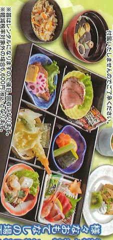
様々なお好みでいただける 法事や行事、お祝い事などの