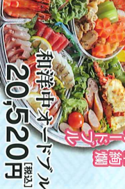
豪華絢爛 人気のお土産品